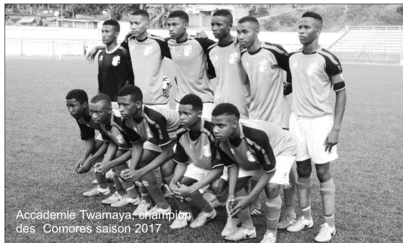
Accadémie Twamaya, champion des Comores saison 2017

« La compétition s'est déroulée dans une bonne ambiance. Les jeunes ont montré et, leur éducation, et leur talent. Nous remercions toutes les personnes physiques et/ou morales qui ont contribué à la tenue et au succès de la compétition. Les U17 de Style Nouvel n'ont pas démerité. Des efforts sont encore nécessaires. Chaque partie a probablement retenu un enseignement