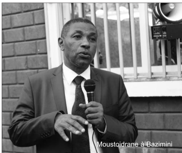
Moustoidrane à Bazimini

Celui qui assure l'intérim du chef de l'Etat plaide devant les Anjouanais en faveur de « l'intérêt général ». « Ne nous focalisons pas sur la Tournante juste parce qu'on veut qu'un anjouanais soit au pouvoir. Défendons une cause qui sera pour l'intérêt de la nation car c'est notre avenir et celui de nos enfants dont il est question. Méfions-nous de ces égoïstes qui agissent pour leur propre compte ». Dans la cohorte d'opinions actuelle, l'on ne peut que