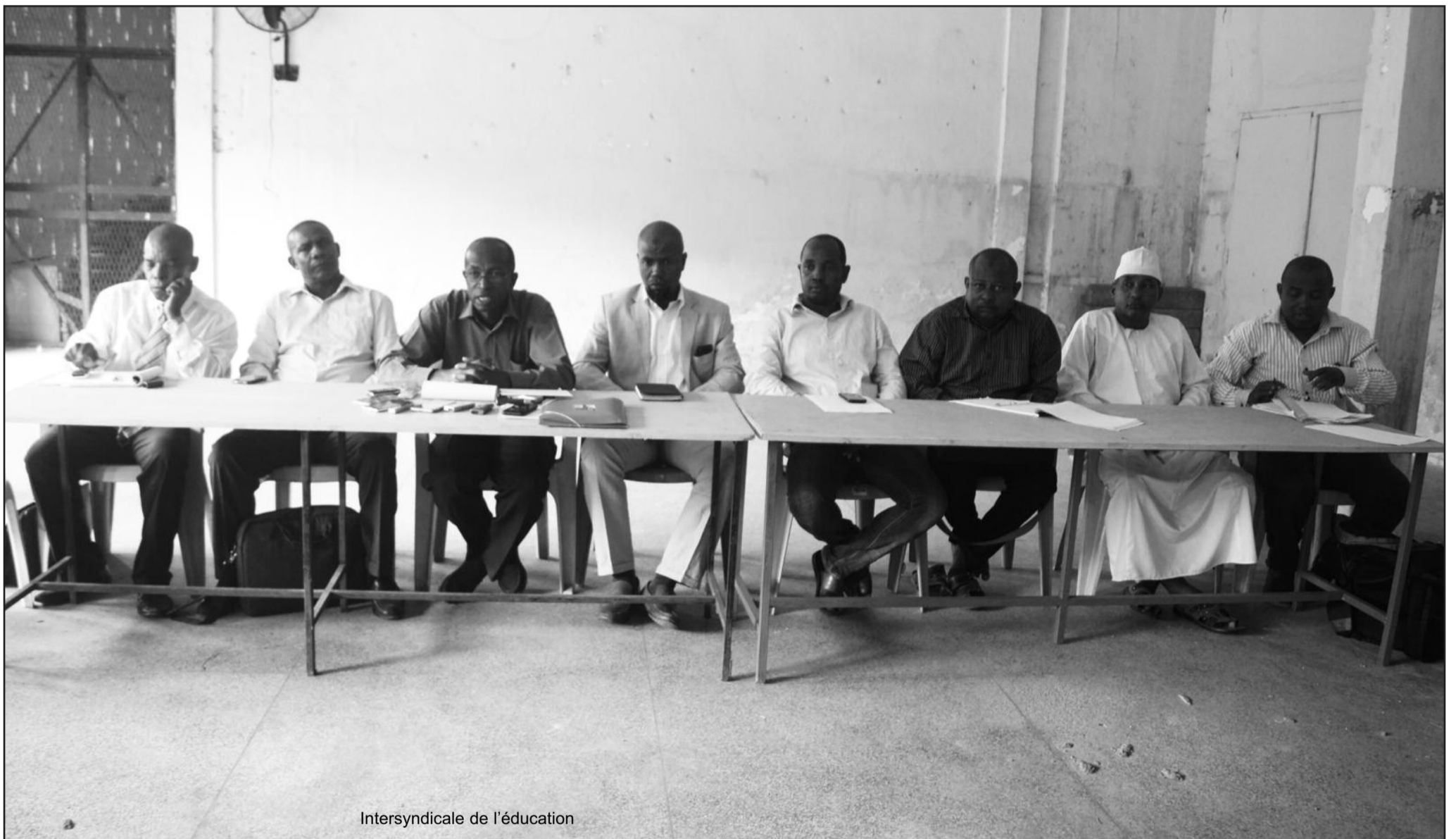
Intersyndicale de l'éducation

L'horizon se dégage un petit peu pour la rentrée scolaire de cette année. Après le syndicat national des instituteurs de Ngazidja, au tour du syndicat des professeurs au niveau de l'île d'opter pour la rentrée tout en poursuivant leurs revendications.