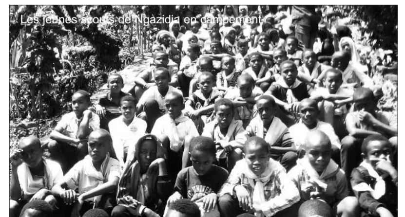
Les jeunes scouts de Ngazidja en campement