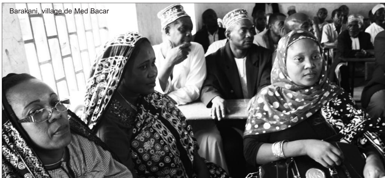
Barakani, village de Med Bacar

déduire que les « égoïstes qui agissent pour leur propre compte » sont le parti Juwa et alliés.