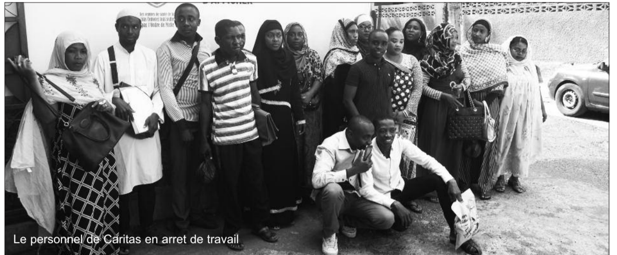
Le personnel de Caritas en arret de travail

Autre point qui a poussé le personnel soignant de Caritas à grever est l'augmentation des tarifs pour les brûlés ces derniers temps. Ils restent convaincus que ces nouvelles pratiques vont en l'encontre du statut du centre qui était fait pour les plus démunis. « Aujourd'hui, pour un petit brûlé, le patient doit dépenser beaucoup pour faire son pansement