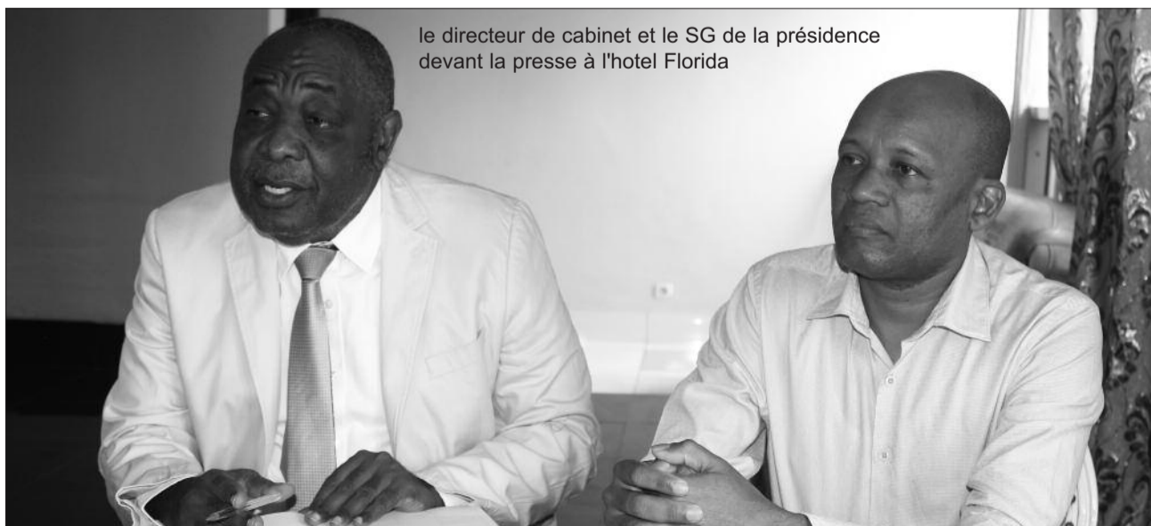
le directeur de cabinet et le SG de la présidence devant la presse à l'hotel Florida