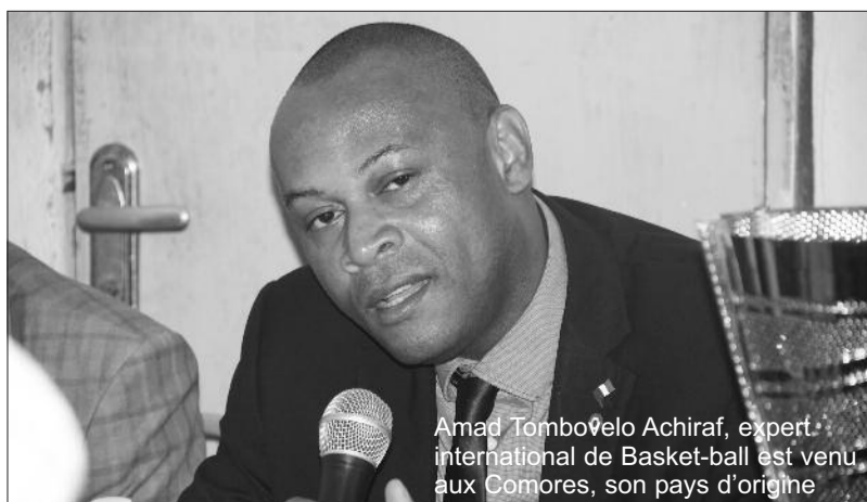
Amad Tombovelo Achiraf, expert international de Basket-ball est venu aux Comores, son pays d'origine